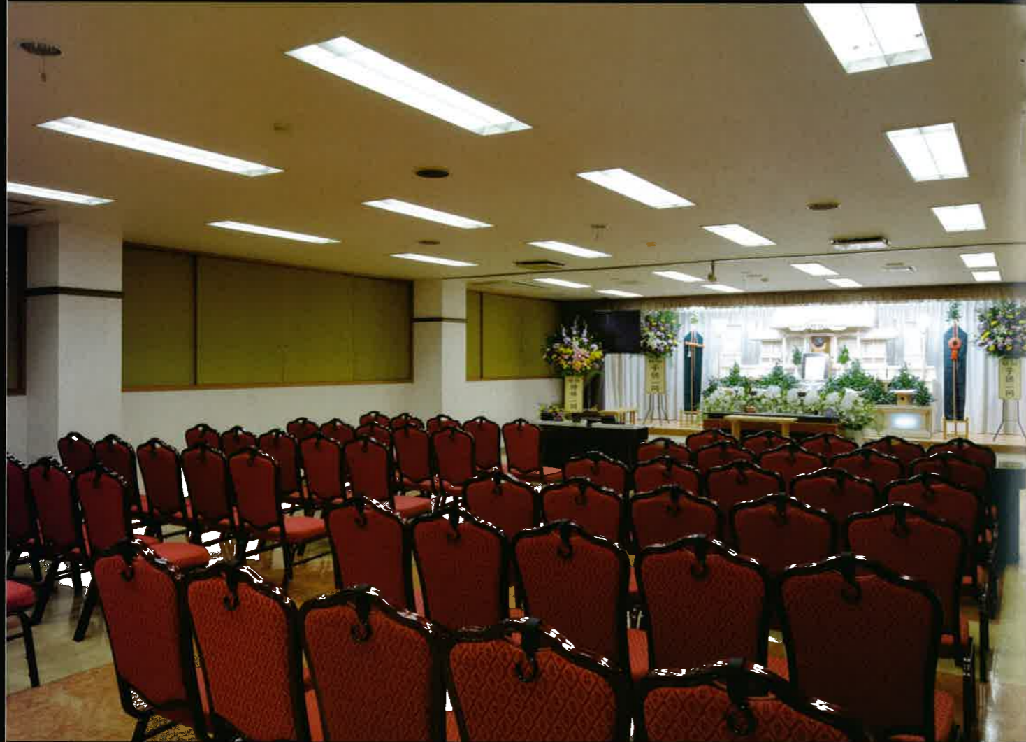
〈祭壇イメージ〉 1F:70~120名収容 2F:30~70名収容

会場はそれぞれ1階、2階と独立していますので、ゆとりのあるスペースで葬儀を執り行えます。