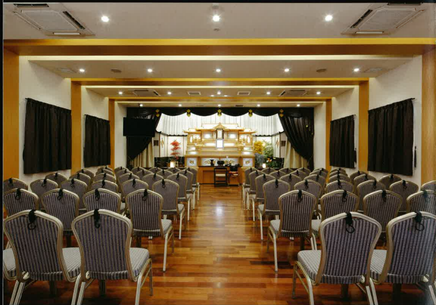
2F第1ホール / 70~100名収容

国道499号線沿い、小ヶ倉バス停より徒歩1分の場所に位置する小ヶ倉メモリードホール。 150台駐車できる駐車場、リニューアルによりさらに美しく快適になったバリアフリー対応の控室とホール。 ホテル並みの設備とサービスで、個人葬から大型葬まで真心のこもったご葬儀をお手伝い致します。