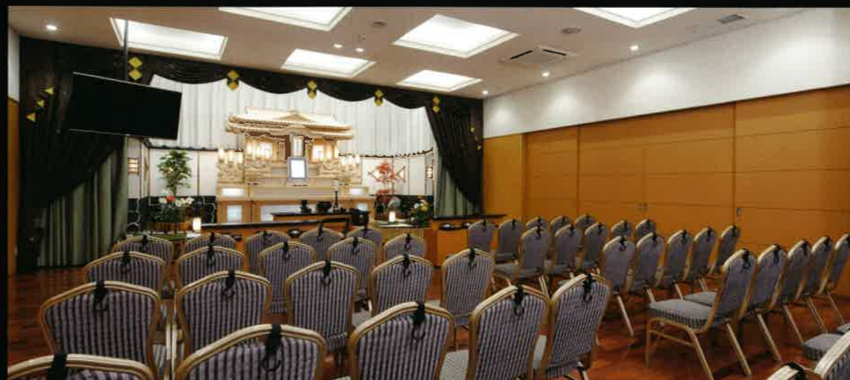
2F第2ホール / 40~60名収容